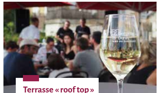
Terrasse « roof top »